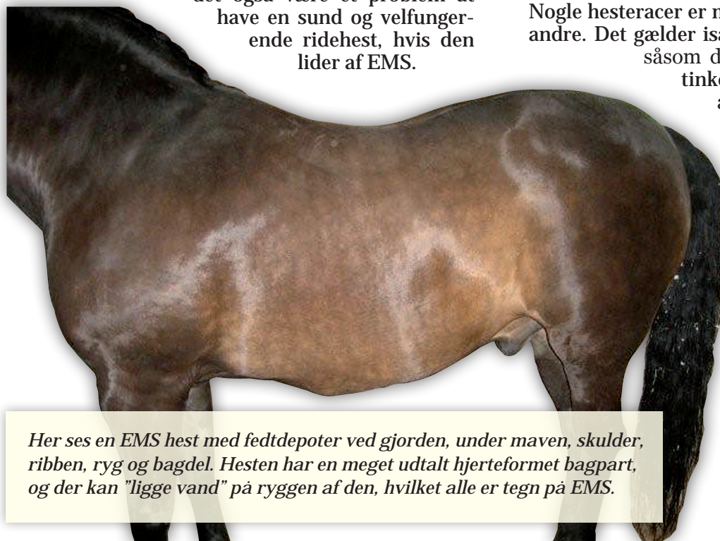
Her ses en EMS hest med fedtdepoter ved gjorden, under maven, skulder, ribben, ryg og bagdel. Hesten har en meget udtalt hjerteformet bagpart, og der kan "ligge vand" på ryggen af den, hvilket alle er tegn på EMS.

Som nævnt aflejres fedtet i depoter især på manken, mankammen og på bagdelen over haleroden. Udover, at det ikke ser pænt ud, vil det også være et problem at have en sund og velfungerende ridehest, hvis den lider af EMS.